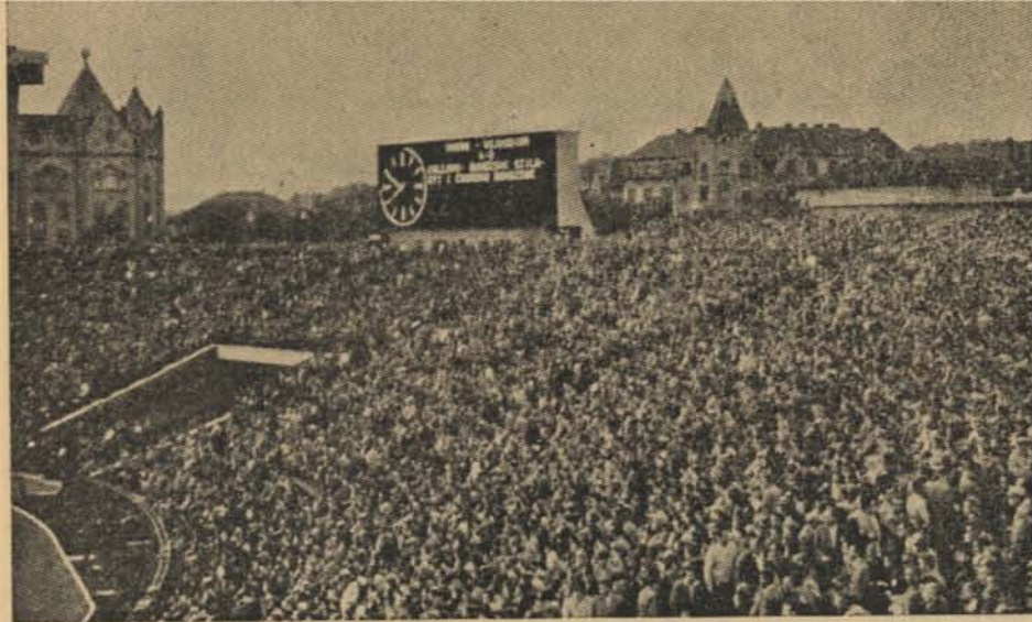
Будапеща. „Непстадион“ е отново пълен