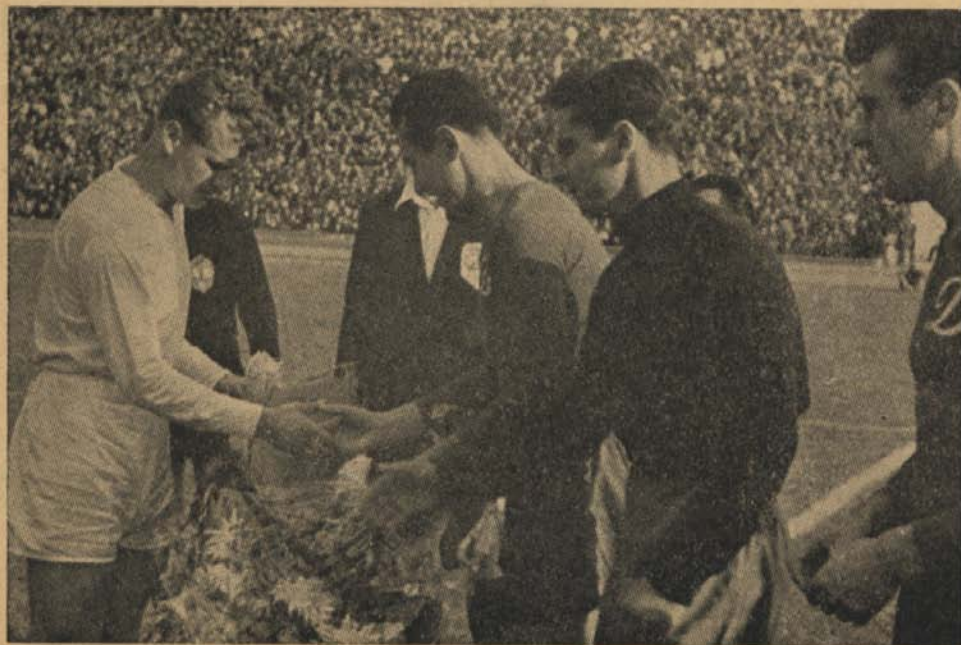
Преди започване на срещата ЦДНА — „Динамо“ (Букурещ)

Елис не се разсърдил. Напротив — той се фотографирал с подаръците и изпратил за спомен една снимка на находчивия си приятел.